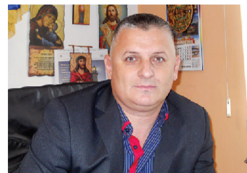
editorial Liviu Muntean

muncă, la cea de confecții metalice sunt aproximativ 30 de angajați, în timp ce la magazinul Profi lucrează 9 persoane. De asemenea, alți 5 oameni au fost angajați de Consiliul Județean Timiș, prin Direcția Generală de Asistență Socială și pentru Protecția Copilului Timiș, care a preluat creșa din comună. Pe această cale, autoritățile locale reamintesc tuturor agenților economici că se bucură de tot sprijinul pentru a-și dezvolta afacerile pe raza comunei noastre.