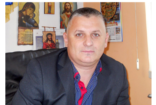
editorial Liviu Muntean

Locală (PNDL). Aici, în urma unei finanțări de peste 3.500.000 de lei, se vor face lucrări de reabilitare, modernizare și dotare, pentru ca atât elevii, cât și profesorii, să beneficieze de condiții dintre cele mai bune.