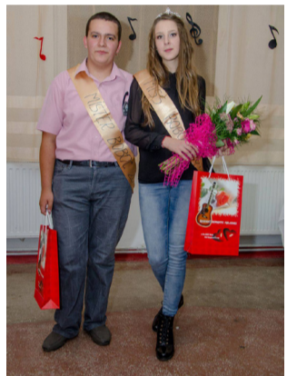
Miss și Mister boboc