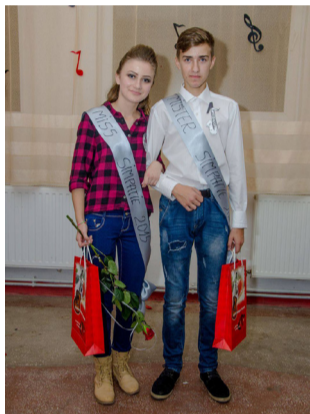
Miss și Mister popularitate