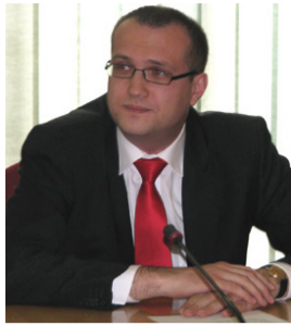
EUGEN DOGARIU PREFECTUL JUDEȚULUI TIMIȘ

Sărbătoare sfântă a Învierii Domnului constituie, pentru toți creștinii, un moment de înaltă trăire sufletească și un prilej de bucurie, trăită alături de cei dragi. În egală măsură, Sfintele Paști constituie un moment de reculegere și de armonie, dar și de reîmprospătare a speranței și a încrederii în viitor. Ca prefect al județului, vreau să împărtășesc, împreună cu dumneavoastră, farmecul și bucuria acestor zile, cât și mesajul dintotdeauna al acestei sărbători: lumină, pace, dragoste și bunățate. Doresc tuturor locuitorilor județului Timiș ca ziua Învierii Mântuitorului să le aducă în suflet fericire și speranță să-și poată petrece aceste momente în deplină liniște, să se bucure de căldura familiei. Sărbători Fericite!