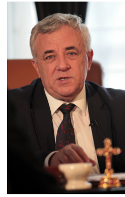
Titu Bojin, Președintele Consiliului Județean Timiș

Sfintele Sărbători ale Paștelui să vă aducă în dar sănătate, prosperitate și speranță. Fie ca lumina Învierii să vă umple sufletele de bucurie și să vă fie prilej de mulțumire și liniște sufletească! Hristos a Înviat!