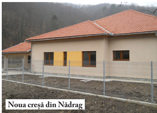
Noua creșă din Nădrag